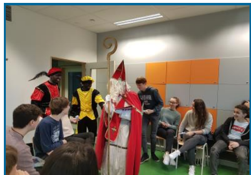
De Sint en zijn 2 pieten kwamen ook langs in Het College om zoetigheden uit te delen.